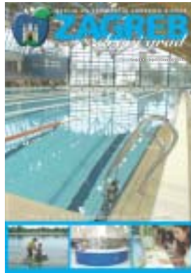
Novi bazen u Utrinama