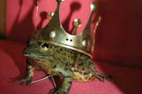
HRVATSKI PRIRODOSLOVNI MUZEJ