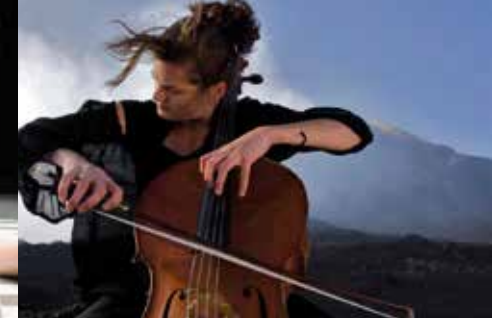
KLUPSKA KAZALIŠNO-GLAZBENA SCENA AMADEO