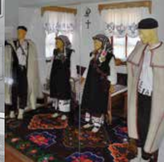
ETNOGRAFSKI MUZEJ ZAGREB