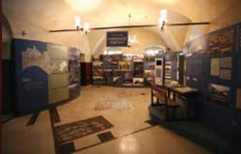
MUZEJ GRADA ZAGREBA