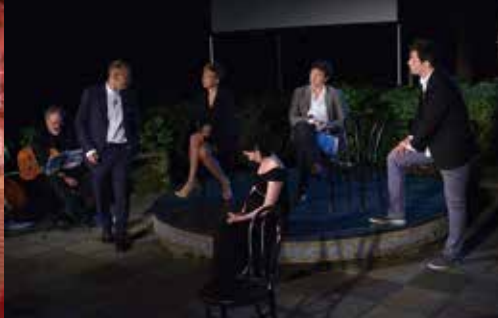
FESTIVAL MIROSLAV KRLEŽA