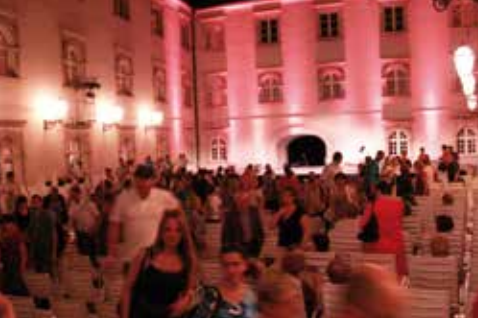
VEČERI NA GRIČU